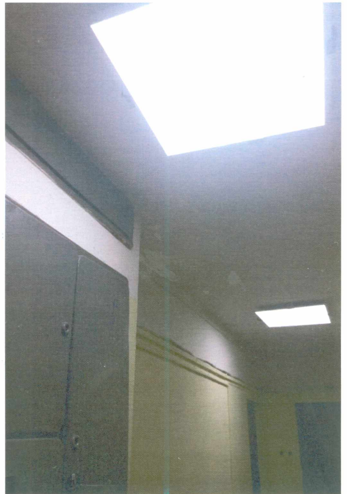
Фото после монтажа светодиодных светильников