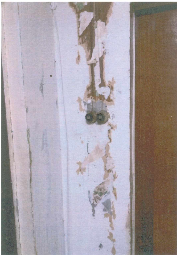
Фото до ремонта