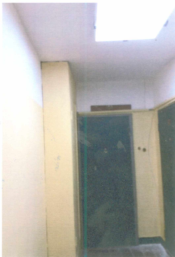
Фото после ремонта